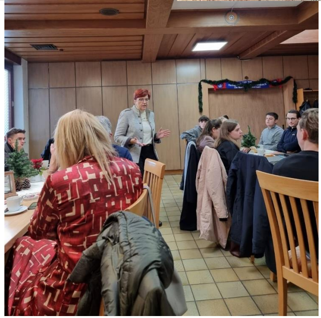
Kreisjahreshauptversammlung der JU Ostalb in Unterrombach-Hofherrnweiler