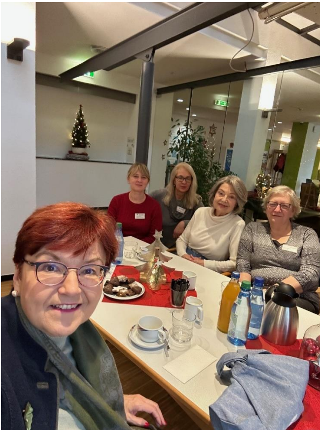
Besuch im Spital zum Heiligen Geist, Stiftung Haus Lindenhof